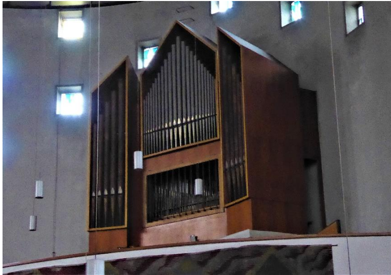
Die Gebrüder Späth-Orgel in St. Hildegard in der Au, Köln-Nippes 1

Nun ist es offiziell: Die Gebrüder Späth-Orgel aus der ehemaligen katholischen Kirche St. Hildegard in der Au in Köln-Nippes wird eine neue Heimat in der evangelischen Stephanus-Kirche in Köln-Riehl finden.