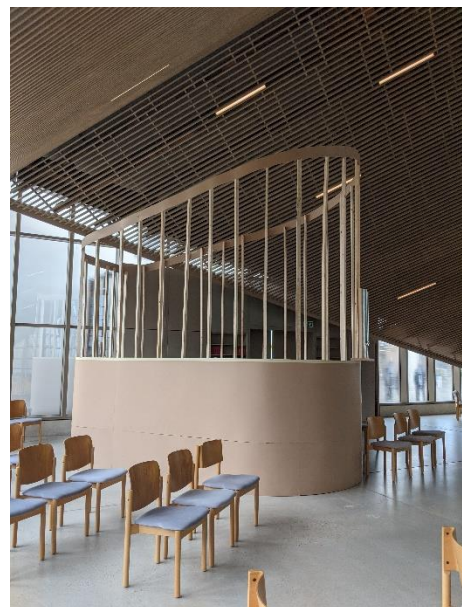
Das originalgroße Modell der neuen Orgel (Foto: Ursula Kutz, Dez. 2021)

Das seit einigen Wochen im Kirchenraum der Stephanuskirche aufgebaute Modell in Originalgröße veranschaulicht das in beeindruckender Weise.